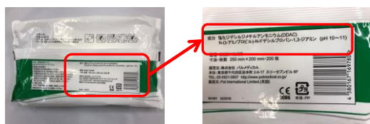
ソフトパックタイプ